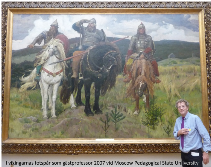
Tretjakov galleriet Moskva